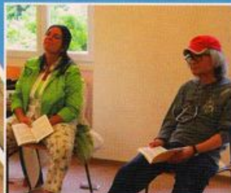
SEIJI OZAWA IMAS